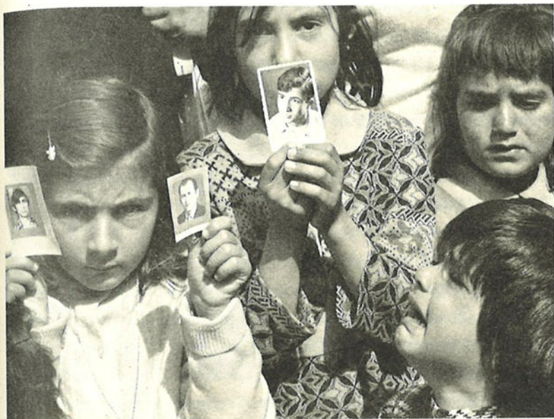
ΜΙΚΡΑ ΠΑΙΔΙΑ ΑΝΑΖΗΤΟΥΝ ΤΟΥΣ ΧΑΜΕΝΟΥΣ ΓΟΝΕΙΣ ΤΟΥΣ.

Ενθαρρυμένοι από τη συμμόρφωση του Κληρίδη στους όρους του, ο οικονόμος Χριστόφορος έκανε ένα βήμα πιο μπροστά, επιδίωξε την αυτοδιάλυση της CMP και ζήτησε την παραίτηση του εκπροσώπου της ελληνοκυπριακής πλευράς Ηλία Γεωργιάδη, με την κατηγορία ότι συνήλθε σε συνεδρία εν αγνοία του προέδρου Κληρίδη και του επιτρόπου προεδρίας για Ανθρωπιστικά Θέματα Λεάνδρου Ζαχαριάδη. Κατά τον οικονόμο Χριστόφορο, η συνεδρίαση της CMP - που συνήλθε εκατοντάδες φορές από την ίδρυσή της - έπρεπε να είχε εκ των προτέρων τη δική του έγκριση.